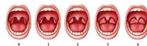
Score de Friedman

Détermination du volume amygdalien par les grades de Friedman : grade 0 : la luette et les piliers de la loge amygdalienne sont visibles ; grade 1 : les amygdales sont cachées dans la loge ; grade 2 : les amygdales dépassent la loge ; grade 3 : les amygdales dépassent largement la loge sans passer le milieu ; grade 4 : les amygdales sont jointives au niveau de la luette.